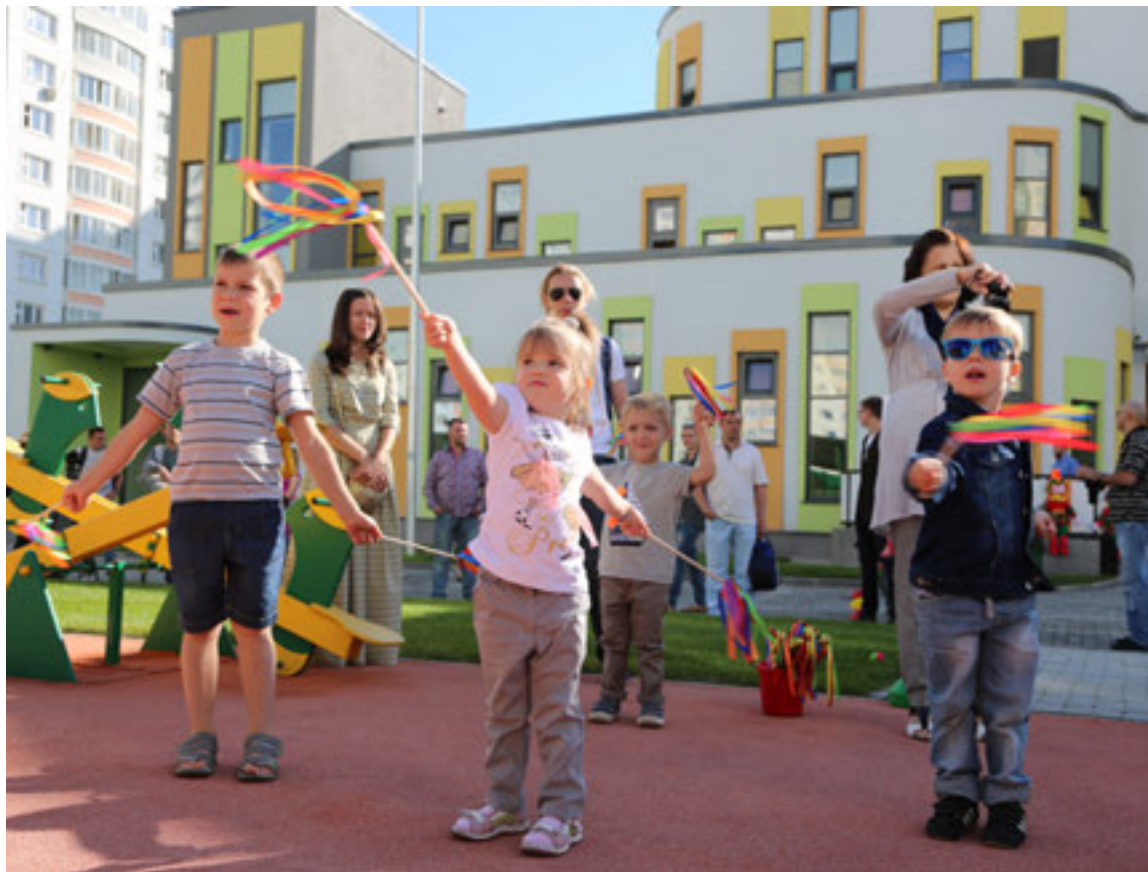
В рамках партийного проекта «Детские сады — детям» до конца следующего года в столице появится еще пять десятков детских садов, в которые будут ходить более 11 тысяч малышей