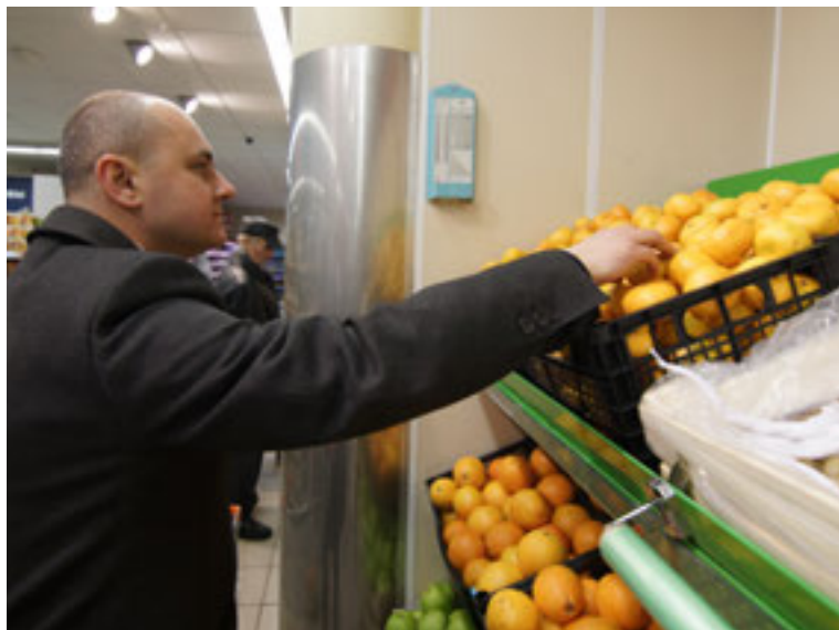
Качество и цены товаров в магазинах активисты «Народного контроля» проверяют дважды в месяц

В конце июня единороссы сравнили цены на продукты в сетевых и магазинах шаговой доступности Северного Измайлова. В ходе предыдущего рейда активисты обратили внимание на завышенную стоимость сахара в магазине «Вавил»: 120 рублей за килограмм против 54 рублей за кило (средняя цена по торговым сетям). Партийцы поставили вопрос на контроль. В итоге, как рассказал член местного политсо-